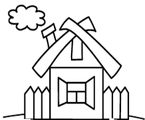
Это их дом.