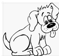
Это их собака.