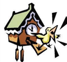
Это их часы.